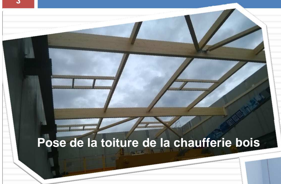
Pose de la toiture de la chaufferie bois

Le planning initial des travaux, bien que ambitieux, a été globalement tenu.