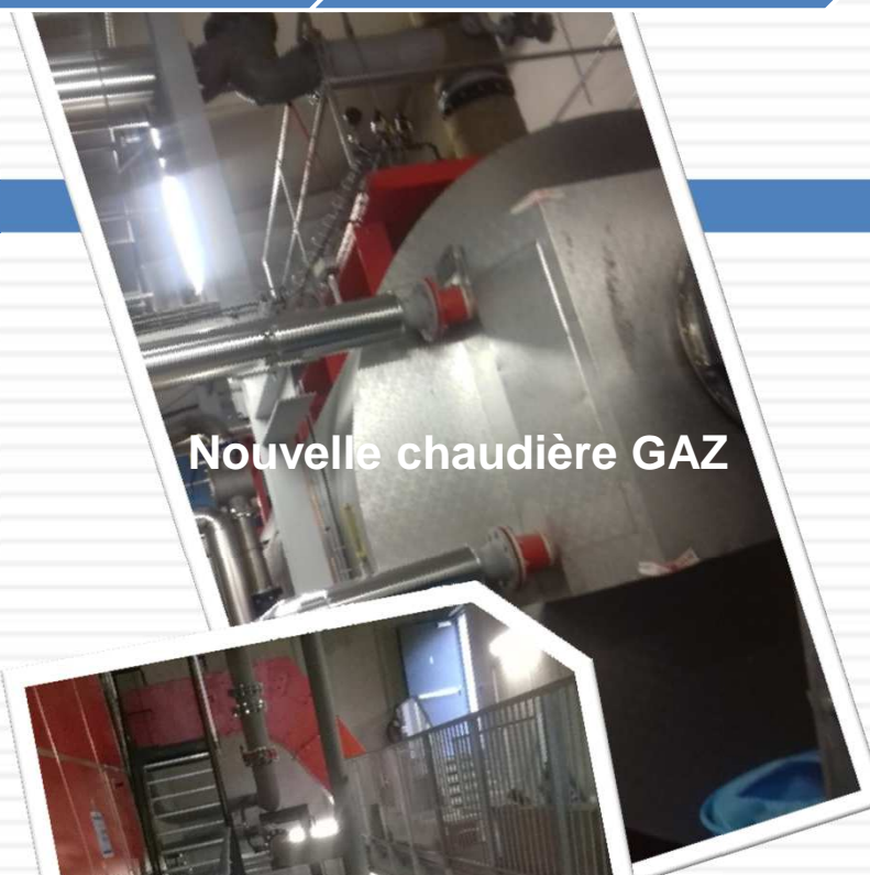
Nouvelle chaudière GAZ