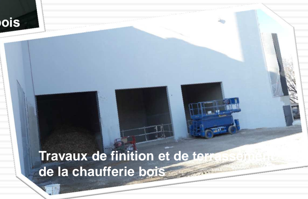
Travaux de finition et de terrassement de la chaufferie bois

Il y a eu quelques décalages, qui n'ont eu d'impact ni sur les dates de mise en route des installations ni sur la fourniture d'énergie auprès des usagers.