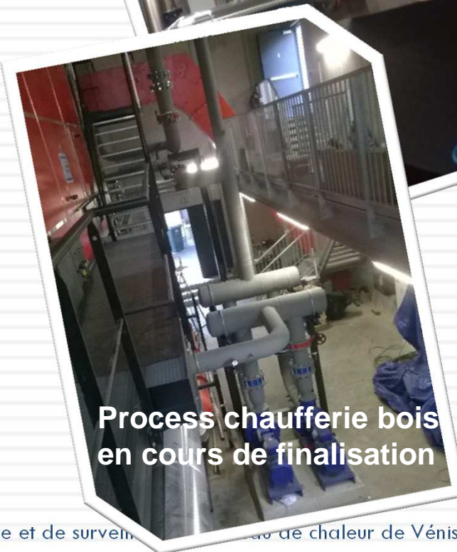
Process chaufferie bois en cours de finalisation